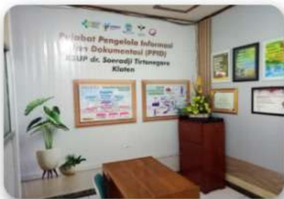
Ruang Pelayanan PPID (terletak di Area Tim Kerja Hukum dan Humas)