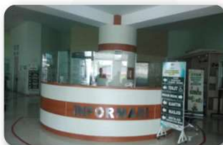
Ruang Pelayanan Informasi (terletak di Gedung Instalasi Rawat Jalan Lantai 1)